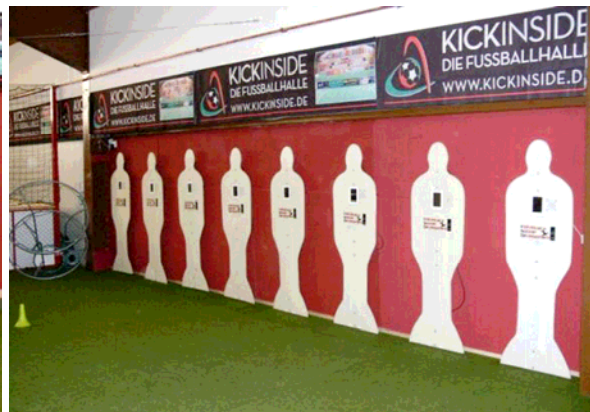
TDW- Technical Development Wall