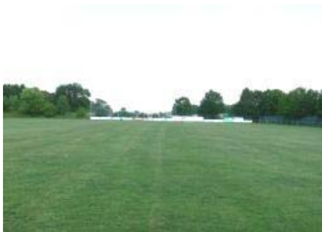
Kunstrasenplatz des ESV Crailsheim,