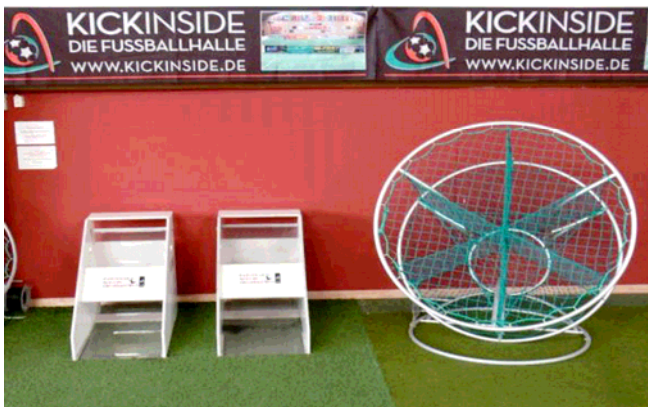
Replayer & Global Goal