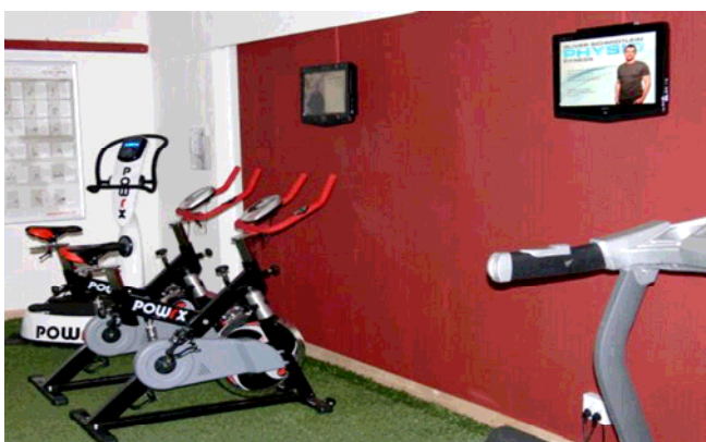
Speedbike, Vibrationsplatte, Laufband