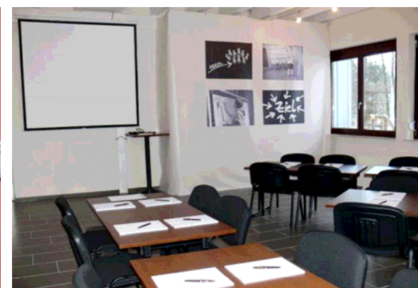
Besprechungsraum mit Beamer u. Großleinwand