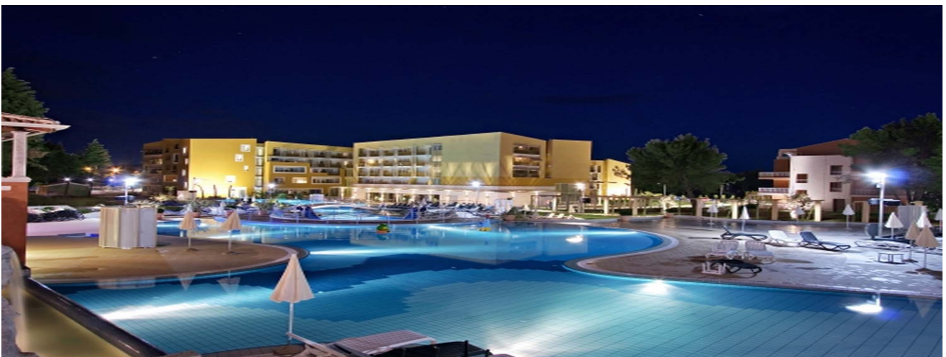
Hotel Sol Garden Istra

Das in unmittelbarer Nähe zum Hotel Sol Garden Istra gelegene Schwester-Hotel Village Sol Garden Istra liegt gleich beim eindrucksvollen Wasserpark mit Pools und ist die perfekte Wahl für einen dynamischen sportlichen Urlaub. Die Gäste des Village können alle Einrichtungen des Hotels Sol Garden Istra benutzen.