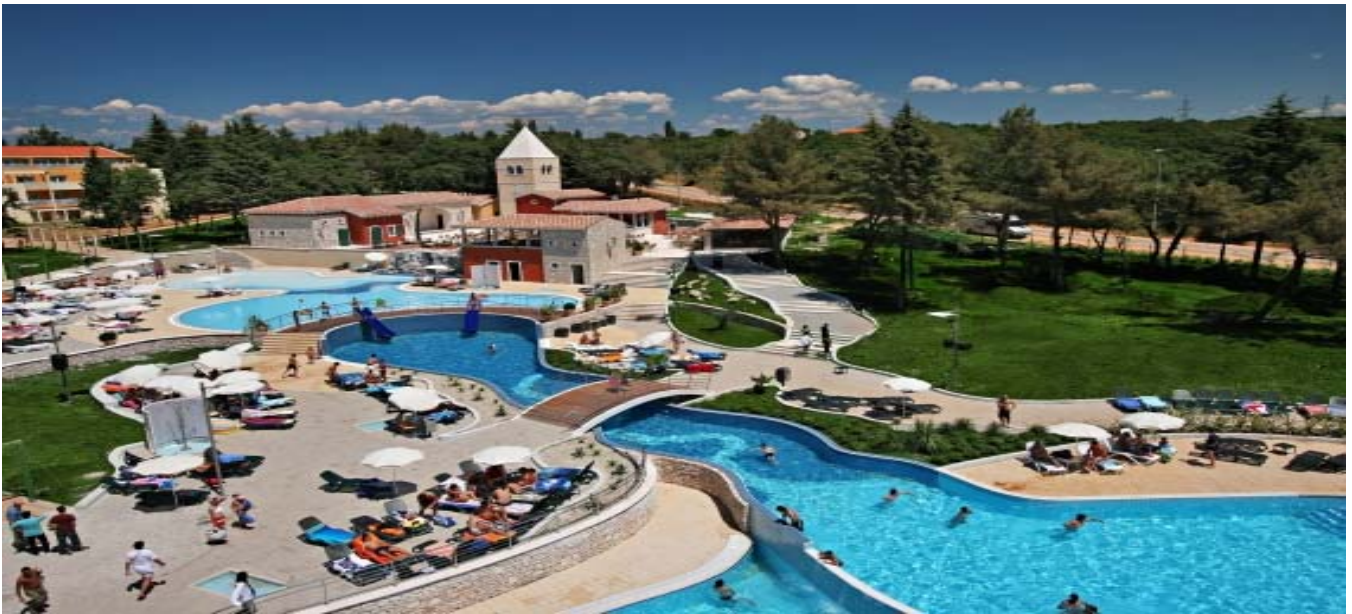
Village Sol Garden Istra