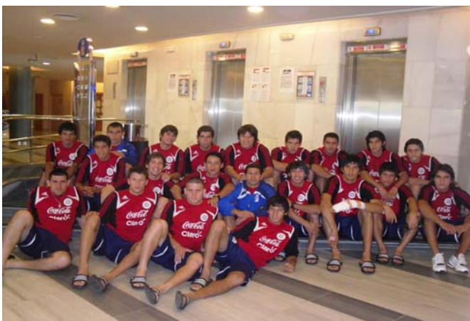
Die U 20 Nationalmannschaft von Paraguay während des Trainingslagers im Hotel AQUAMARINA in Santa Susanna